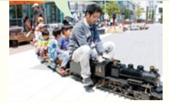
出展:名古屋工業大学鉄道研究会 整理券は、岐阜シティ・タワー43お買物券(200円)ご購入の方に進呈。

運行時間 各回60名 ①11:00~ ②12:00~ ③13:00~ ④14:00~